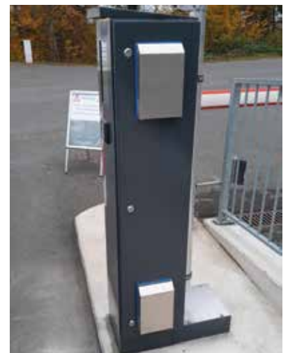
Terminal wurde versetzt für eine bessere Erreichbarkeit