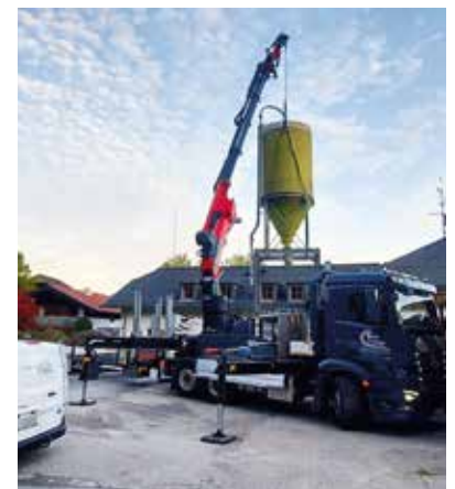
Übersiedlung des Salzsilos