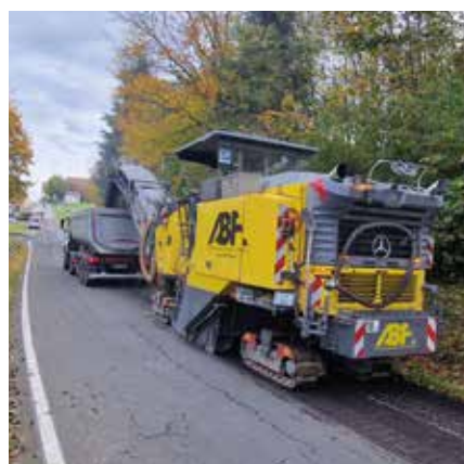
Asphaltierung Knoten Mattsee Süd