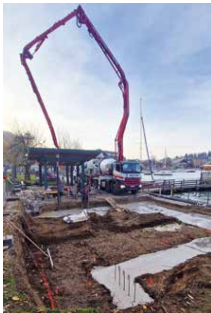
Ein neuer Musik-Pavillon entsteht