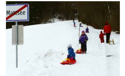
Bob- und Rodelspaß alte Münsterholzstraße