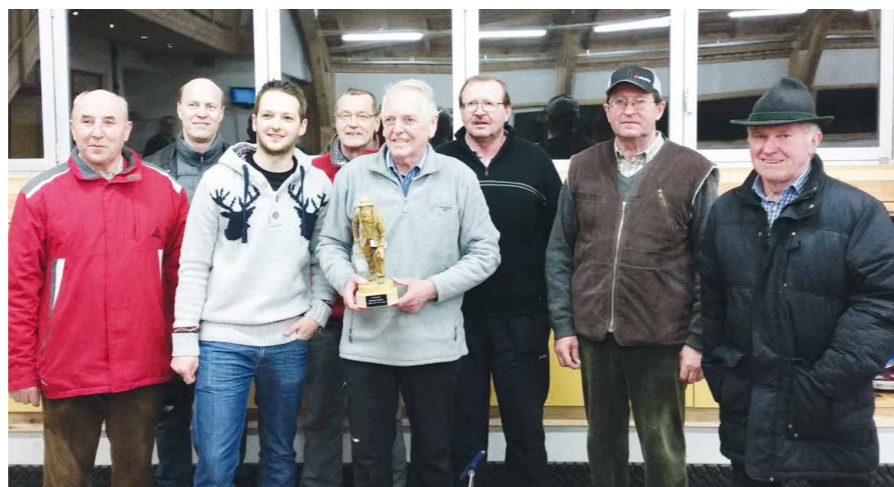
Die Finalmannschaften der Vereinemeisterschaft im Stockschießen.

anstaltung wurde es ein schöner und gemütlicher Tag für uns alle.