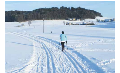
alte / neue Loipe in Betrieb