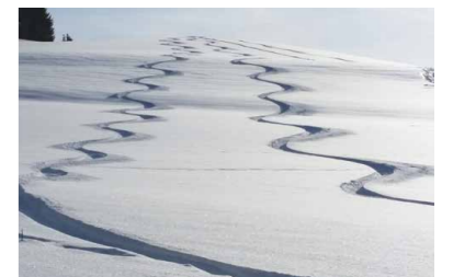
Snowboardspuren in Ochsenharing