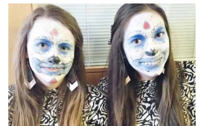
Fasching im Haus Weyerbucht perfekt geschminkt