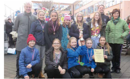
Die Landesmeisterinnen.