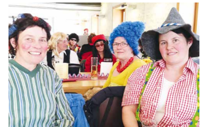
Bäuerinnenfasching kreative Verkleidungen