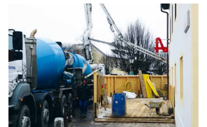
Apothekenumbau im vollen Gange