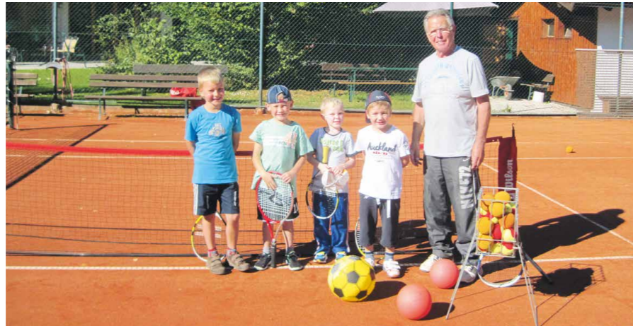
Kindertennis beim UTC Mattsee.

Für unsere Jugend ab 10 Jahren, sind heuer jeweils dienstags von 15 bis 17 Uhr je nach Bedarf, ein oder zwei Plätze zum Freispielen reserviert. Um unseren Jugendlichen ein Training zu ermöglichen, wird unsere Jugendleiterin anwesend sein, um allen beim Training mit Rat und Tat zur Seite zu stehen.