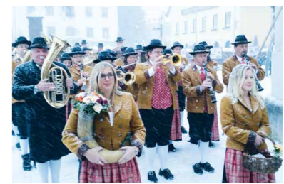
tiefwinterliche JHV der Trachtenmusikkapelle