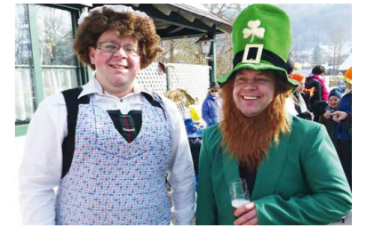
Kinderfasching ohne Worte