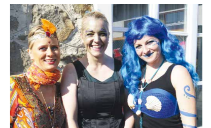
Kindergartenfasching auch für unsere Pädagoginnen