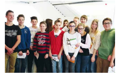
Hauptschule zu Besuch am Tag der offenen Tür im Poly