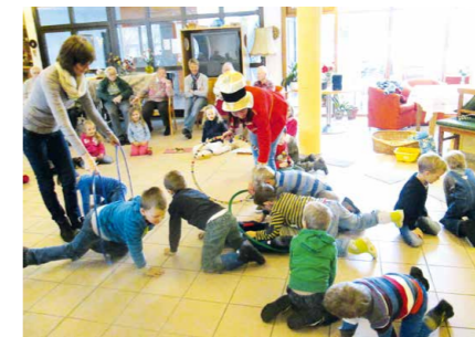
„Manege frei“ für den Kindergarten.

um jeglichen Druck zu nehmen und den Spaß am gemeinsamen Spiel in den Vordergrund zu rücken. So wurde die erste Vorstellung ohne jegliches Material gestaltet, mit reiner Phantasie und der Vorstellungskraft des wachsenden Publikums. Die zweite Show wurde unter den Schwerpunkt Musik gesetzt. So kamen die Kinder unter anderen mit selbst gebauten Instrumenten und begleiteten als Combo selbst ihre Auftritte. Damit wurde es auch dieses Mal wieder eine kunterbunte Vorstellung, mit Tüchern, Bällen, Tieren, Tänzen, Gesang und noch viel mehr.