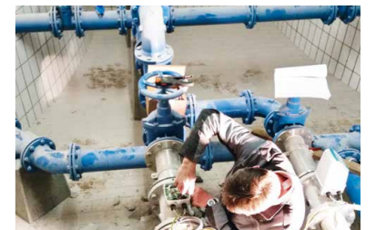
Umbau der zentralen Wassersteuerung