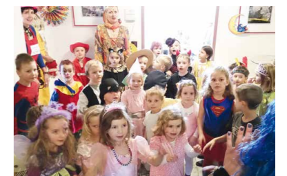
Kindergartenfasching Prinzessinnen, Hexen, Clowns,...