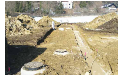
Baulandaufschließung Am Egartl