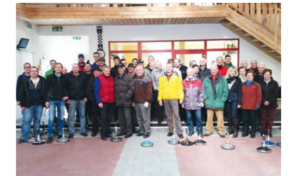
Vereinemeisterschaft Jung und Alt mit Ehrgeiz dabei