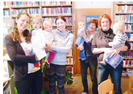
Besuch in der Bibliothek.

Über den Besuch der „Sonnescheinchen“ vom EKIZ am 2. Februar freuten wir uns sehr!