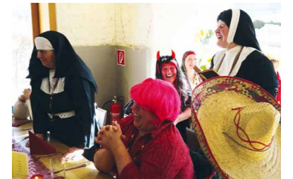
Bäuerinnenfasching beste Stimmung