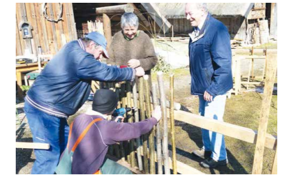
Neuer Zaun Musterstück in Arbeit