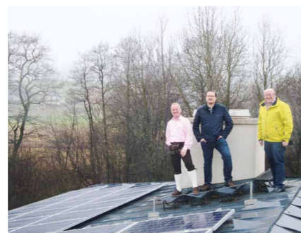
Photovoltaikanlage am Dach der Kläranlage.

zeugt, könnte ca. 15 durchschnittliche Haushalte versorgen, wird aber zur Gänze beim Klärprozess im eigenen Betrieb verbraucht.