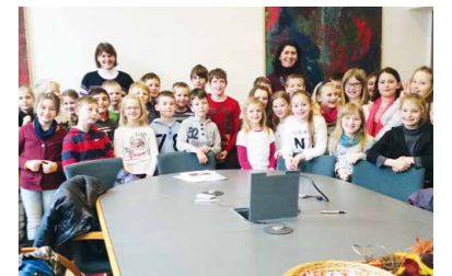
3. Klassen der Volksschule Ortskunde im Gemeindeamt