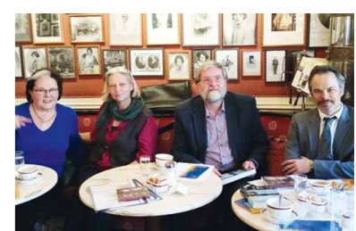
Pressekonferenz Diabelli Sommer im Hotel Sacher