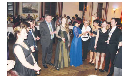
Seglerball tolle Stimmung im Schloss Mattsee