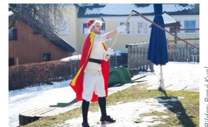
Fasching im Gemeindeamt Prinz „Sturm“ als Schnalzer