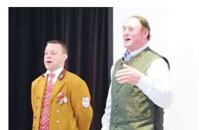
Mattsee Lied in doppelter Form