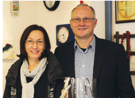
Uhren und Schmuck für jeden Anlass – von antik bis modern – findet man bei Juwelier Reinhard Maria Damisch.

Zu den Eckpfeiler von KREMO (kreativ & modern) gehört es, moderne Uhren namhafter Hersteller wie unter anderem Jacques Lemans, Seiko, Ingersoll, anzubieten und zu warten. Speziell hochwertige Vintage Uhren (Rolex, Jaeger LeCoultre, IWC, Omega, usw.) werden in Zukunft nach genauer Prüfung angekauft sowie zum kommissionsweisen Verkauf übernommen.