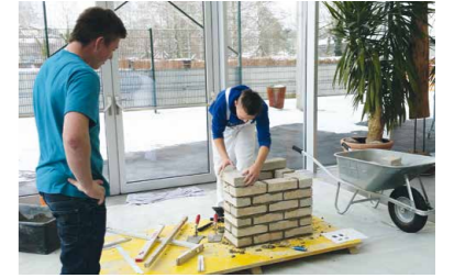
Tag der offenen Tür Polytechnische Schule