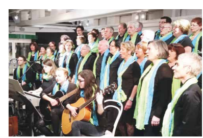
Diabelli Chor Gospelkonzert im fahr(T)raum