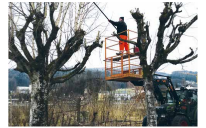
Bauhof Baumschnitt Strandbad Allee