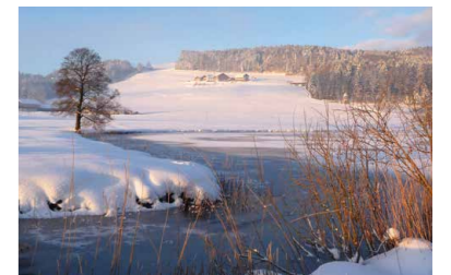
Naturschutzgebiet Egelseen