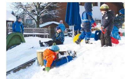
volle Winteraction im Kindergarten