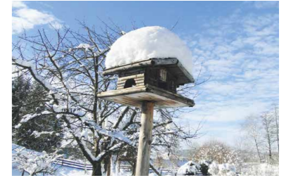
schneebedecktes Häuschen