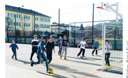
HS/PTS Schulsportplatz voll belebt