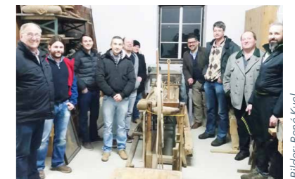
GV Besichtigung Fahrnisse Heimatmuseum