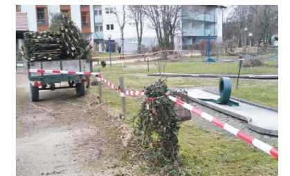
Abbruch alter Zaun rund um den Minigolfplatz